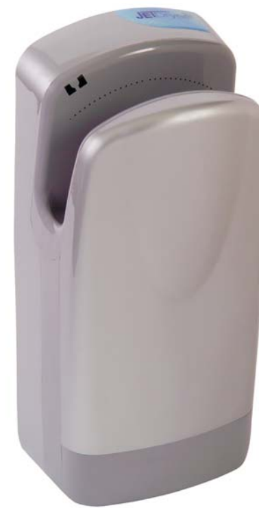
provedení SF – ABS, stříbrný matný