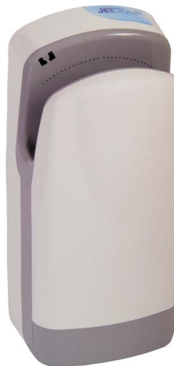
provedení BF – ABS, bílý