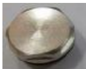
1x záslepka (E)