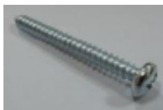
4x upevňovací šrouby (C)