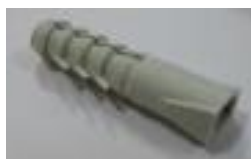
4x hmoždinka (B)