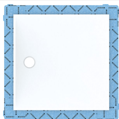
Obrázek s příkladem