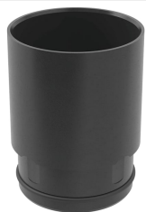
Obrázek s příkladem