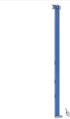
Obrázek s příkladem